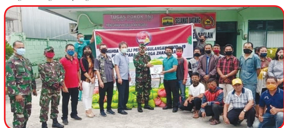
Persaudaraan Marga Zhang Riau bersama dengan anggota Koramil setempat menyerahkan paket sembako.