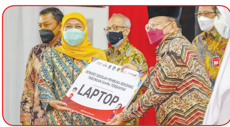
Gubernur Khofifah secara simbolis memberikan hadiah laptop pada sekolah pembuka rekening SimPel terbanyak.

pelajar untuk memiliki budaya menabung di lembaga jasa keuangan. Sekaligus membuka akses bagi pelajar, untuk dapat memanfaatkan produk keuangan formal lainnya. Sementara itu, Gubernur Jawa Timur Khofifah Indar Parawansa mengatakan bahwa kegiatan puncak KREASI, merupakan salah satu pintu masuk peningkatan literasi dan inklusi keuangan. "Namun yang tidak kalah penting adalah meningkatkan prestasi pelajar di Indonesia, termasuk di Jawa Timur. Kami sangat bangga dengan prestasi yang telah dicapai oleh pelajar SMA/SMK di Jawa Timur," ujarnya. Menurut Khofifah, untuk tahun ini pelajar SMA dan SMK dari Jawa Timur yang masuk ke PTN tanpa tes maupun dengan tes, baik melalui jalur regular maupun non regular, menjadi yang tertinggi di antara seluruh provinsi se-Indonesia. Ia berharap, prestasi ini tetap dipertahankan di tahun-tahun mendatang. • anto tse