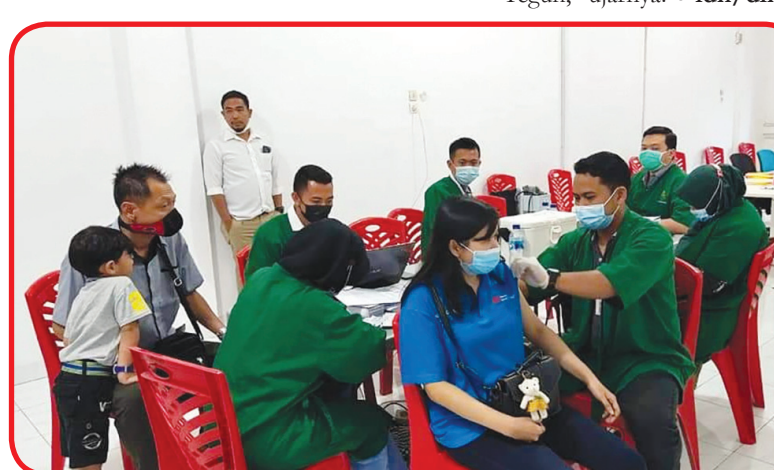
Suasana vaksinasi Covid-19 yang diselenggarakan Persaudaraan Marga Zhang Riau.

besar marga Zhang dunia akan dihidupkan kembali.