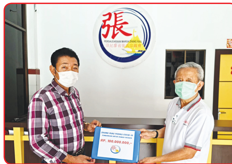
Perwakilan Persaudaraan Marga Zhang Riau menyerahkan sejumlah dana kepada "Rumah Oksigen".