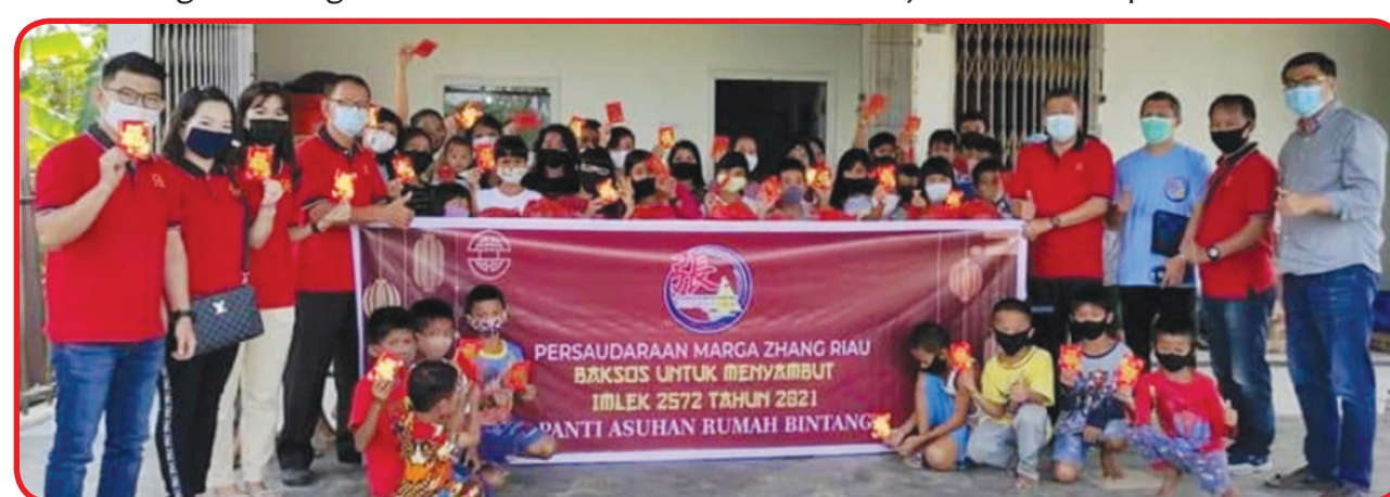
Pengurus Persaudaraan Marga Zhang Riau menyerahkan angpao kepada anak penghuni panti asuhan.