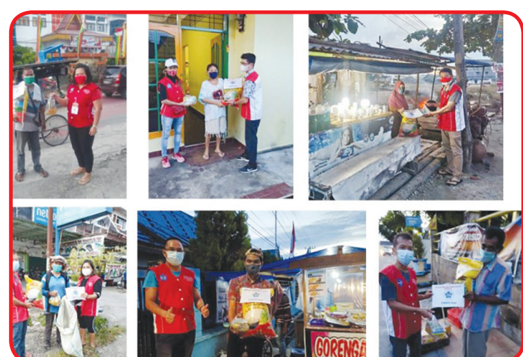
Perwakilan pengurus PSMTI Riau menyerahkan paket bantuan sosial kepada warga terdampak PPKM level 4.

RIAU (IM) - PSMTI (Paguyuban Sosial Marga Tionghoa Indonesia) Riau telah menyelenggarakan kegiatan sosial "PSMTI Riau Peduli" dalam bentuk pemberian bansos (bantuan sosial) kepada masyarakat atau pedagang kecil