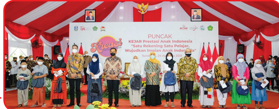
Foto bersama usai pemberian bantuan biaya dan peralatan pendidikan pada pelajar yang membutuhkan.