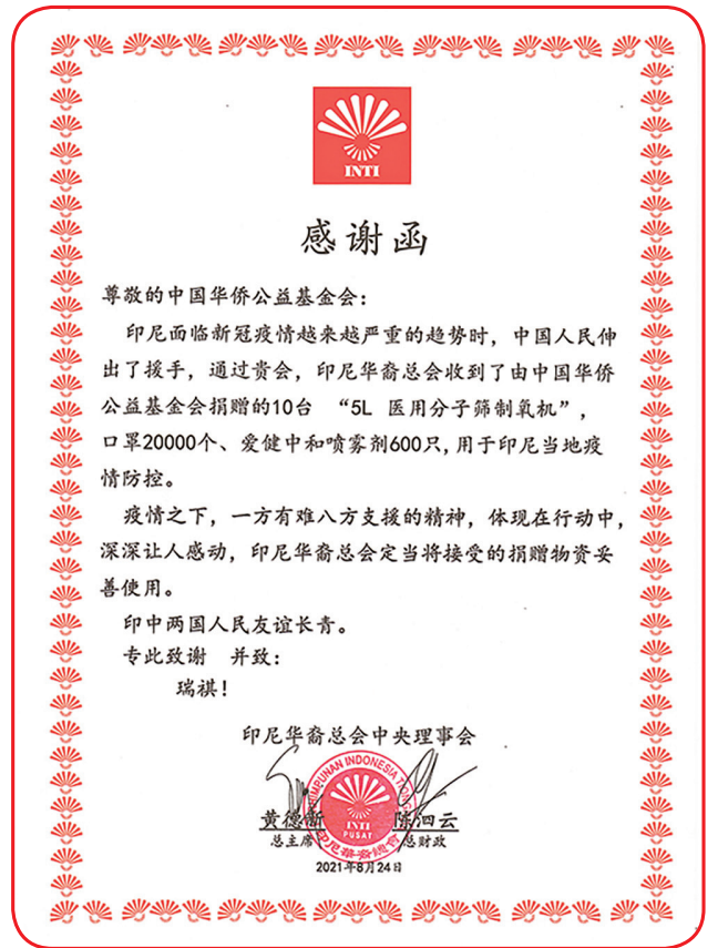
Piagam penghargaan dari Perhimpunan INTI kepada OCCFC

gah dan mengendalikan pandemi Covid-19 dengan lebih baik. Juga melindungi diri kita sendiri. Satu hari kelak semuanya akan pulih seperti semula. • idn/din